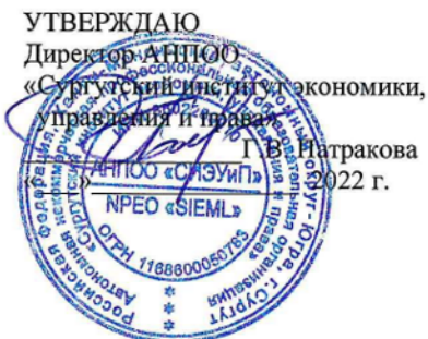
ГРАФИК ПРОМЕЖУТОЧНОЙ АТТЕСТАЦИИ