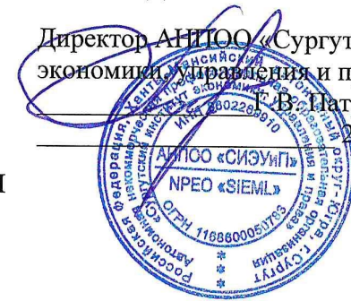
ГРАФИК ПРОМЕЖУТОЧНОЙ АТТЕСТАЦИИ