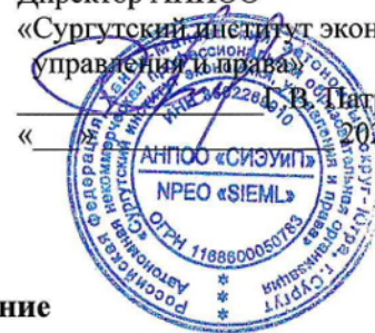
ГРАФИК ПРОМЕЖУТОЧНОЙ АТТЕСТАЦИИ