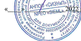
ГРАФИК ПРОМЕЖУТОЧНОЙ АТТЕСТАЦИИ