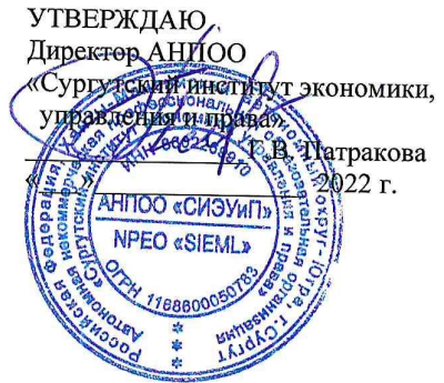
ГРАФИК ПРОМЕЖУТОЧНОЙ АТТЕСТАЦИИ