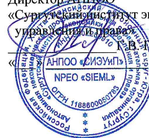
ГРАФИК ПРОМЕЖУТОЧНОЙ АТТЕСТАЦИИ