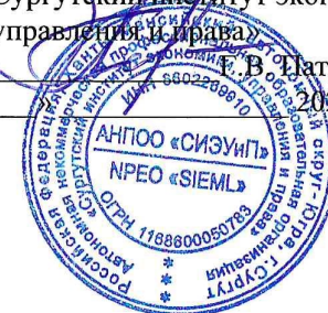
ГРАФИК ПРОМЕЖУТОЧНОЙ АТТЕСТАЦИИ