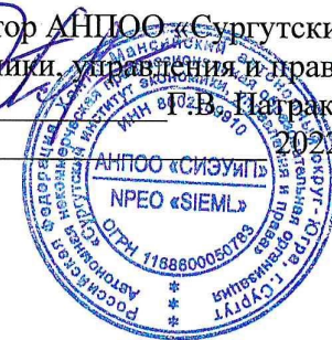
ГРАФИК ПРОМЕЖУТОЧНОЙ АТТЕСТАЦИИ