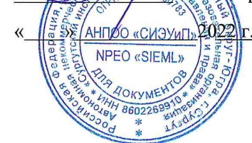
ГРАФИК ПРОМЕЖУТОЧНОЙ АТТЕСТАЦИИ