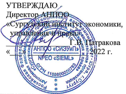
ГРАФИК ПРОМЕЖУТОЧНОЙ АТТЕСТАЦИИ